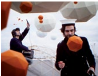
two left ears