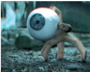
The Origin of Creatures