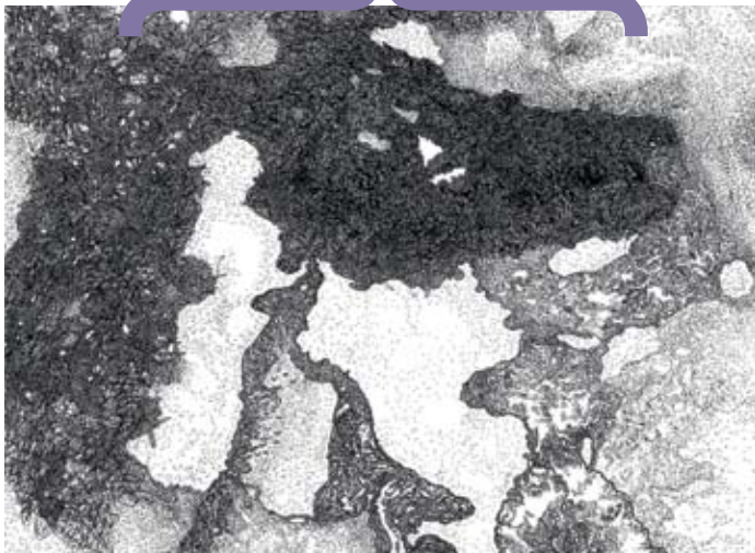
Catharsis (Black Barnabé)