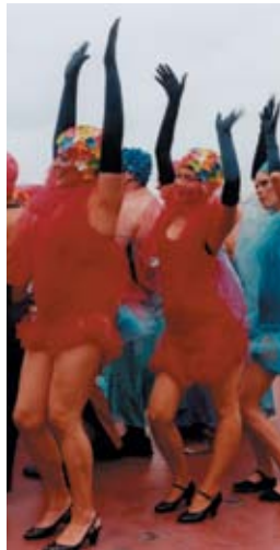
Slap the Gondola !