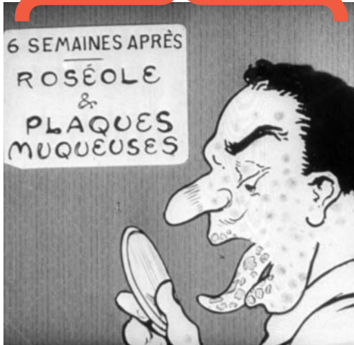
On doit le dire