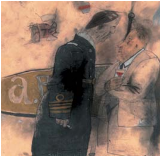
Affiche du Festival du Court Métrage de Clermont-Ferrand 2012