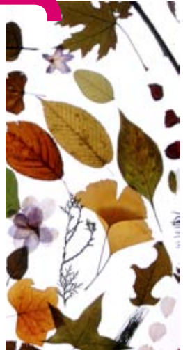
Natural Urban Nature