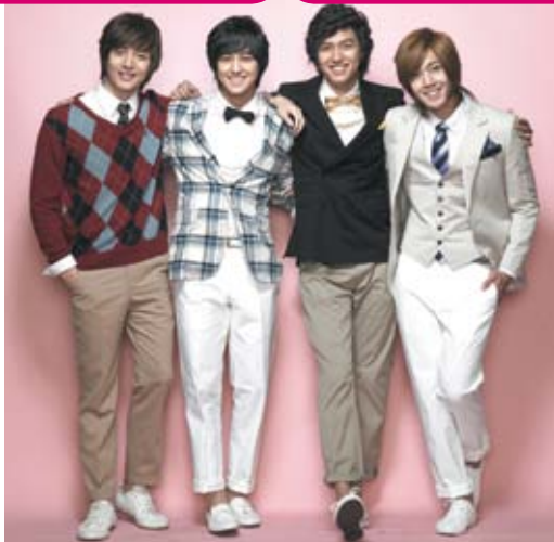
Boys Over Flowers