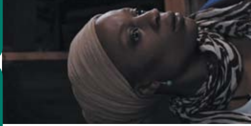
La France qui se lève tôt