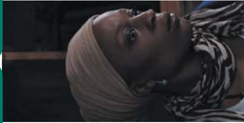
La France qui se lève tôt